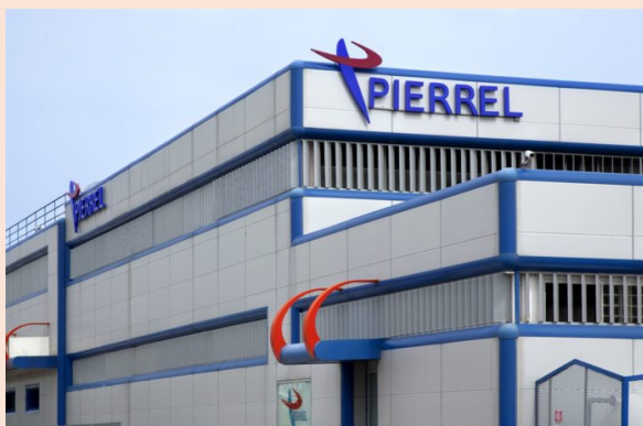
in foto lo stabilimento Pierrel a Capua